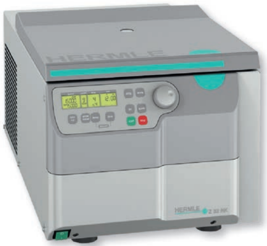
High Speed Kühlzentrifuge Z 32 HK

max. Drehzahl 20.000 min -1 max. Volumen 4 x 145 ml