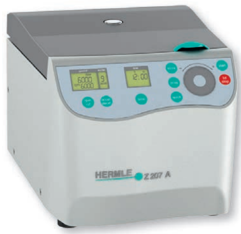
Universelle Kleincentrifuge Z 207 A

max. Drehzahl 20.000 min -1 max. Volumen 4 x 145 ml